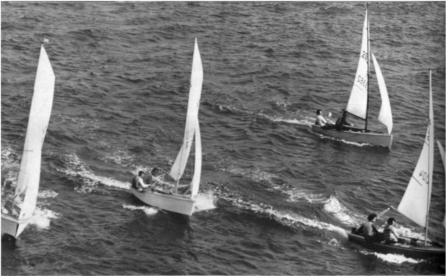
Le Vaurien Roussineau, à droite, s'enfuit devant le Guindé, le Bihoré et le Roga. (de droite à gauche) pour une longue cavale au large de Saint-Malo.