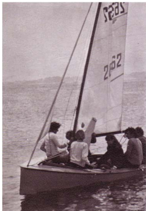
Le triomphe du Vaurien : tout à l'heure bêtes de course, voici nos cavales devenues bêtes de Somme pour l'atterrissage à Cézembre (à gauche) et le mouillage derrière le Sangria de Philippe (à droite).

avec le Roussineau. Et même avec les deux furieux, Guindé- Roga, lorsqu'ils viendront au vent arrière. C'est qu'alors les raffinements de grément ne jouent plus et que, voile de course ou pas, barres de flèche (sur le Roga) ou non, coque plastique ou bois, ancienne ou récente, nous remontons sur Saint-Malo à la même allure. Nous faisons notre entrée au port dans un inattendu rayon de soleil qui prête à l'eau courant sur les petits fonds sableux une lumière d'émeraude palie.