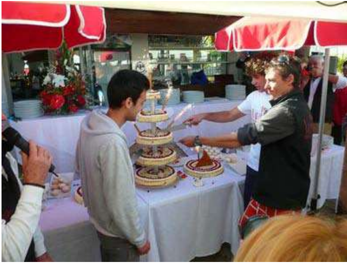
25 - Le banquet final. Luxueux !