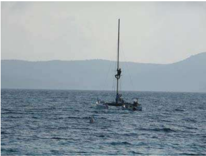
5 - Samedi 7 Avril - Ah l'équipement du bateau comité !