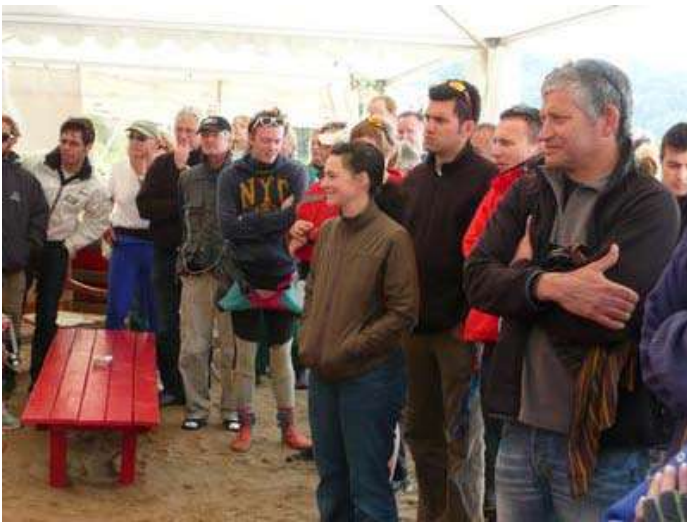
7 - Briefing du Samedi matin.