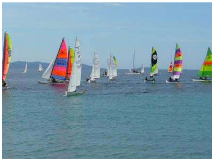
13 - Du ciel bleu, du vent ... Le rêve !