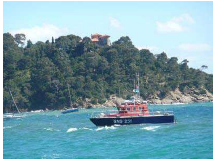
12 - Ici comme ailleurs, ils veillent.