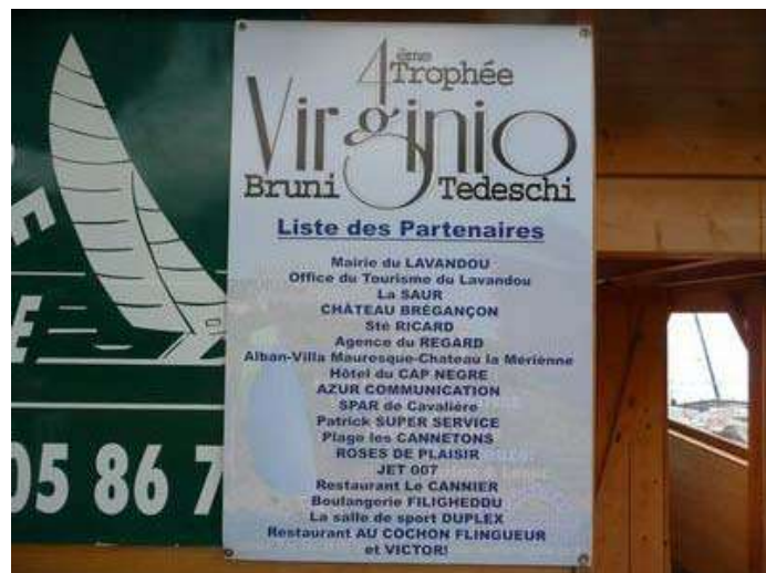
2 - ... la preuve : la liste des sponsors. Rêvons, mes frères !