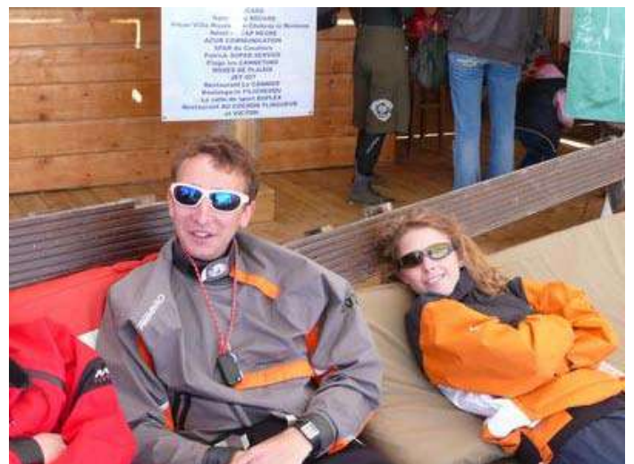
10 - Dé-soeu-vrés ! Les Vandrot patientent.