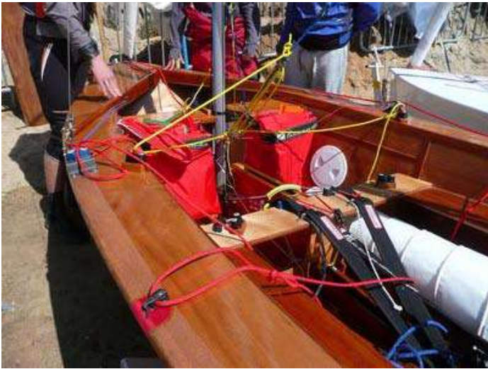
11 - Une superbe construction amateur italienne de 1986