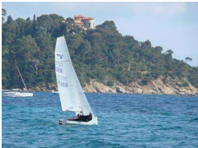
3- Un équipage allemand à l'entrainement.