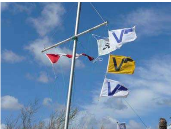
9 - ... ça souffle avec violence. Il est 14 h, le vent est mesuré à 25 noeuds.