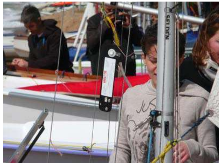
8 - Tiens ! Un tensiomètre ... Cet équipage de jeunes italiennes prend les choses très au sérieux.